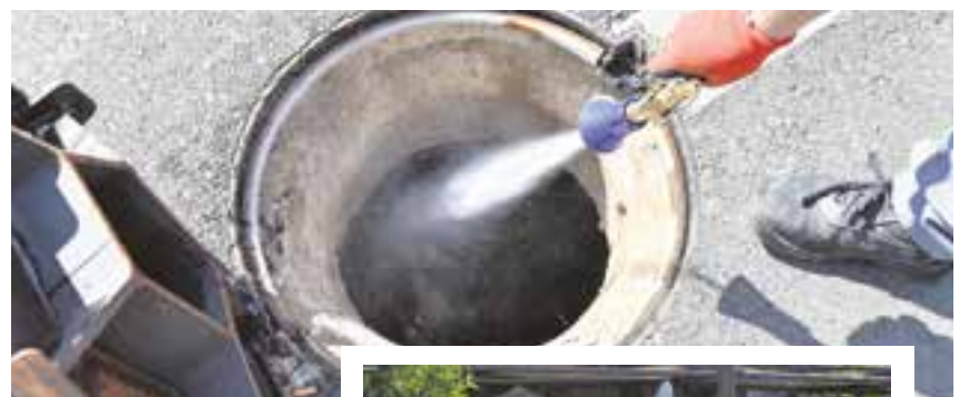
Arriba, actuación en el alcantarillado fruto de la campaña de desratización y desinsectación; al lado, operario trabajando en la Plaza del Ayuntamiento en la campaña contra los mosquitos

No obstante, si una vez realizados estos tratamientos, continúa detectándose el problema en algún lugar específico, los vecinos pueden ponerse en contacto con la Concejalía de Medio Ambiente del Ayuntamiento de Tomares. Esta campaña se suma a la puesta en marcha en mayo para el tratamiento preventivo de control de mosquitos.