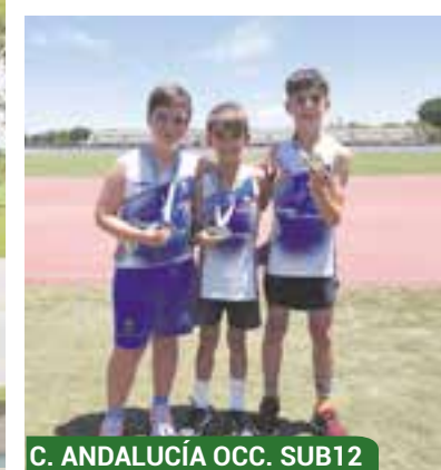
C. ANDALUCÍA OCC. SUB12