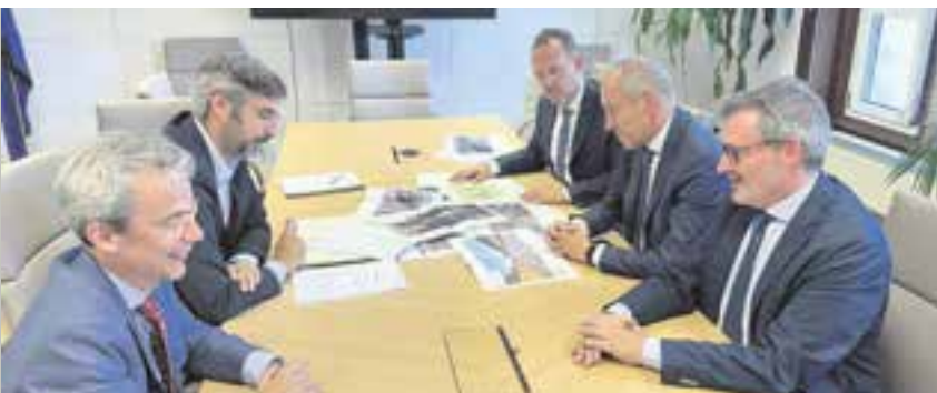
Reunión en la sede del Ministerio de Transportes y Movilidad Sostenible