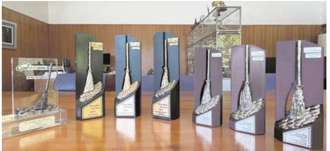
Conjunto de todas las Escobas que ha ganado el Ayuntamiento: una de plata, tres de oro y tres de platino

La instalación del Punto Limpio en Tomares, que cumple ya dos años, supuso un paso más para hacer del municipio uno de los más limpios de España. Un moderno edificio, ecológico, con tecnología de vanguardia de última generación, y construido al 100% con material reciclado. En verano, del 15 de junio al 15 de septiembre permanecerá abierto de lunes a viernes, de 8:00 a 15:00 horas; sábados y festivos, de 10:00 a 15:00 horas. Los domingos estará cerrado.