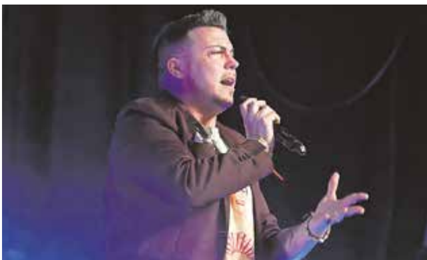
Joaquín Pavón ha lanzado su nuevo single "Contigo pierdo el tiempo"