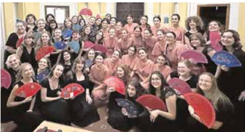
Componentes de la Escolanía junto a las chicas del Tucson Girls Chorus, de EE.UU.