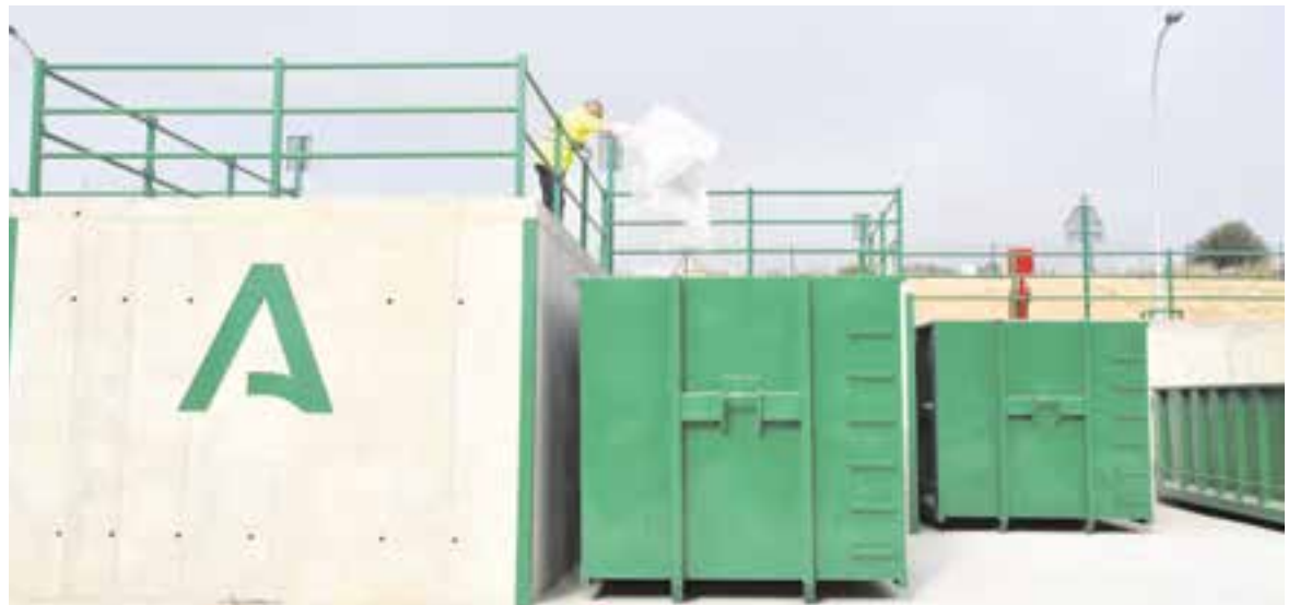
Arriba, Punto Limpio, un edificio ecológico y construido al 100% con material reciclado, que facilita a los vecinos la recogida selectiva de los residuos domiciliarios urbanos que no se pueden depositar en los contenedores habituales ubicados en la vía pública (orgánica, cartón, envases y vidrio); al lado, operario de PreZero baldeando la Plaza del Ayuntamiento