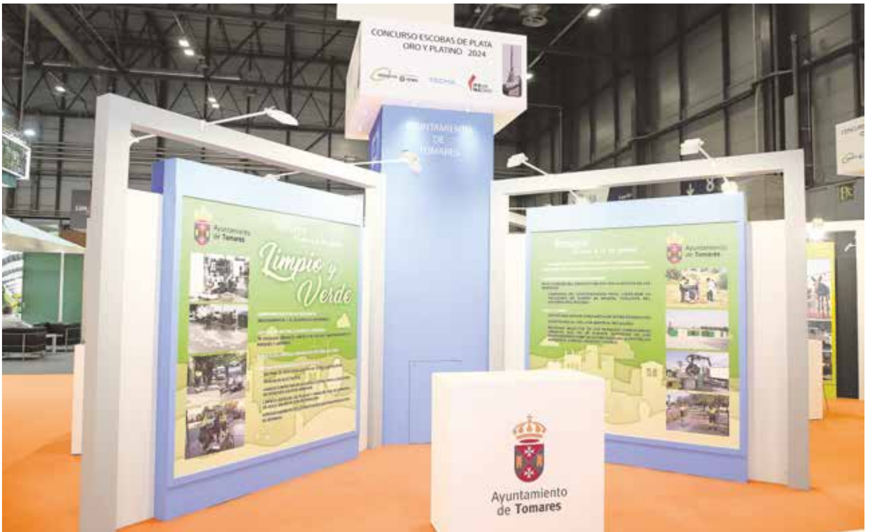
Stand de Tomares para participar en la 19ª edición de este concurso organizado por la Asociación Técnica para la Gestión de Residuos y Medio Ambiente (ATEGRUS)

Por la puesta en marcha del centro de control de incidencias del servicio de limpieza y recogida