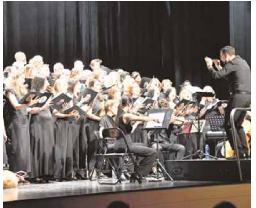
Coral Polifónica ofreciendo su concierto de final de temporada en el Auditorio