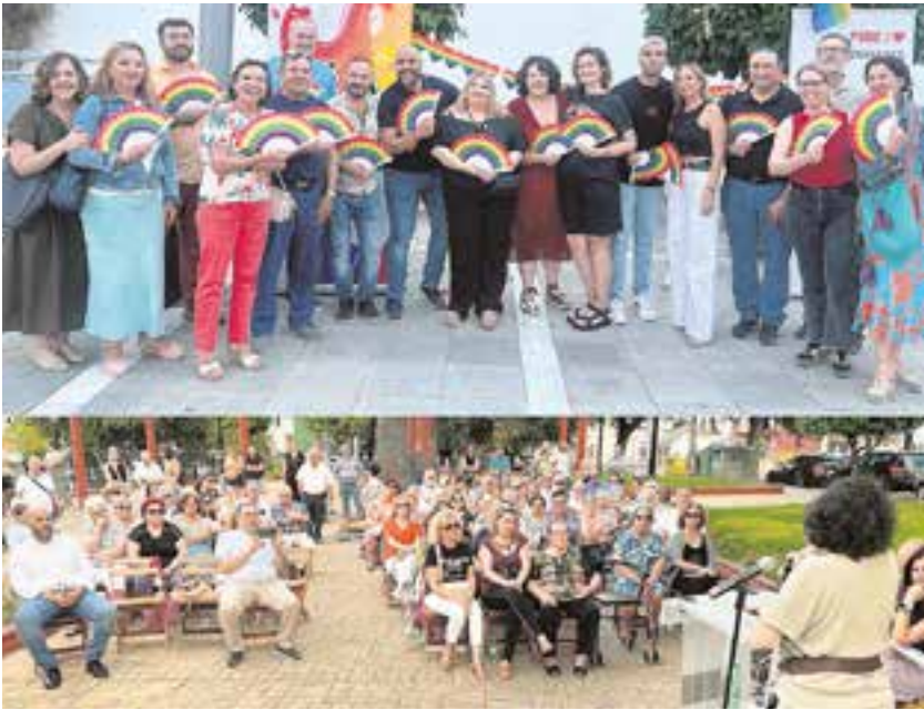
Actos socialistas de Memoria y Orgullo