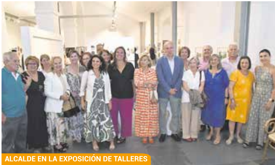
ALCALDE EN LA EXPOSICIÓN DE TALLERES