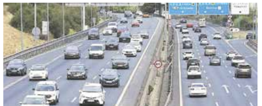
Las pantallas acústicas se instalarán en la A-49 a su paso por Tomares

El Ministerio de Transportes y Movilidad Sostenible iniciará en un corto plazo la primera fase de la licitación y redacción de los trabajos de la instalación de pantallas acústicas en la A-49 a su paso por Tomares. Un proyecto que el Ayuntamiento de Tomares lleva años reclamando, con el objetivo de solucionar el problema de ruido que