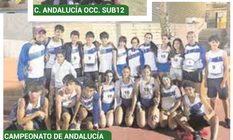
CAMPEONATO DE ANDALUCÍA