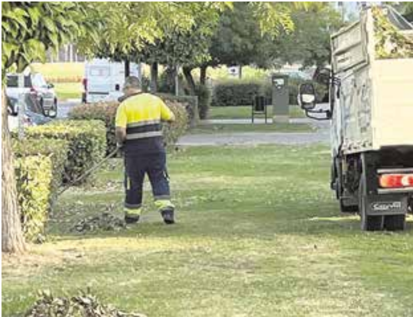
ATEGRUS ha concedido la Escoba de Platino al Ayuntamiento de Tomares