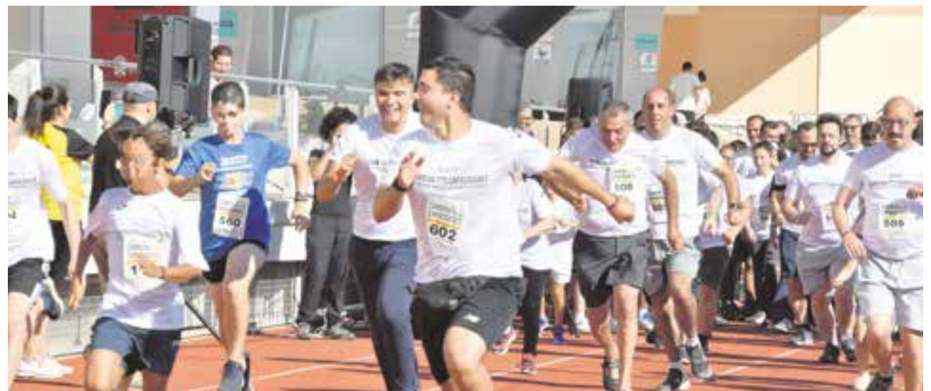
Participantes realizando la XV Carrera de las Capacidades, que se llevó a cabo por primera vez en Tomares