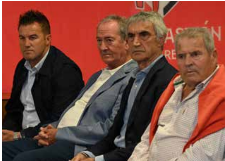
Exjugadores del Sevilla invitados al 60 aniversario de la Peña Sevillista