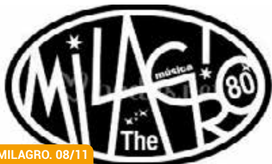
THE MILAGRO. 08/11