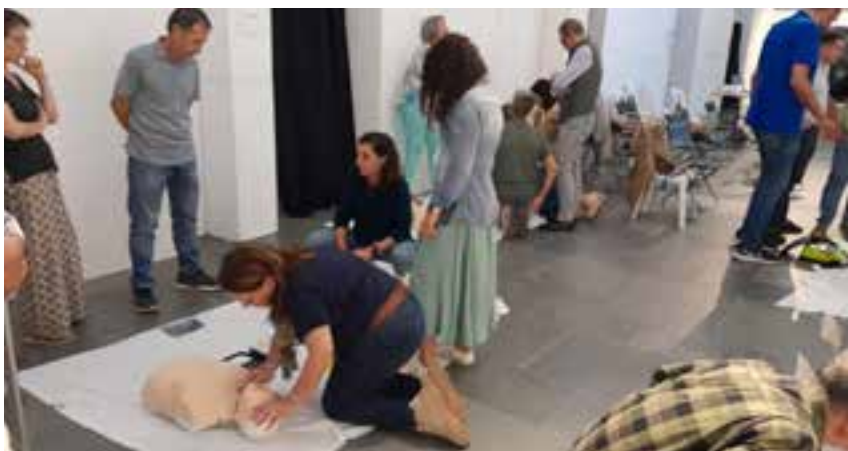
La jornada de primeros auxilios en el deporte tuvo lugar en la Sala de Exposiciones

acompañado del alcalde, José María Soriano, y la concejal de Deportes, Gema Sánchez-Barriga. Tras el acto conmemorativo del 60 aniversario tuvo lugar una cena en el restaurante La Grama.