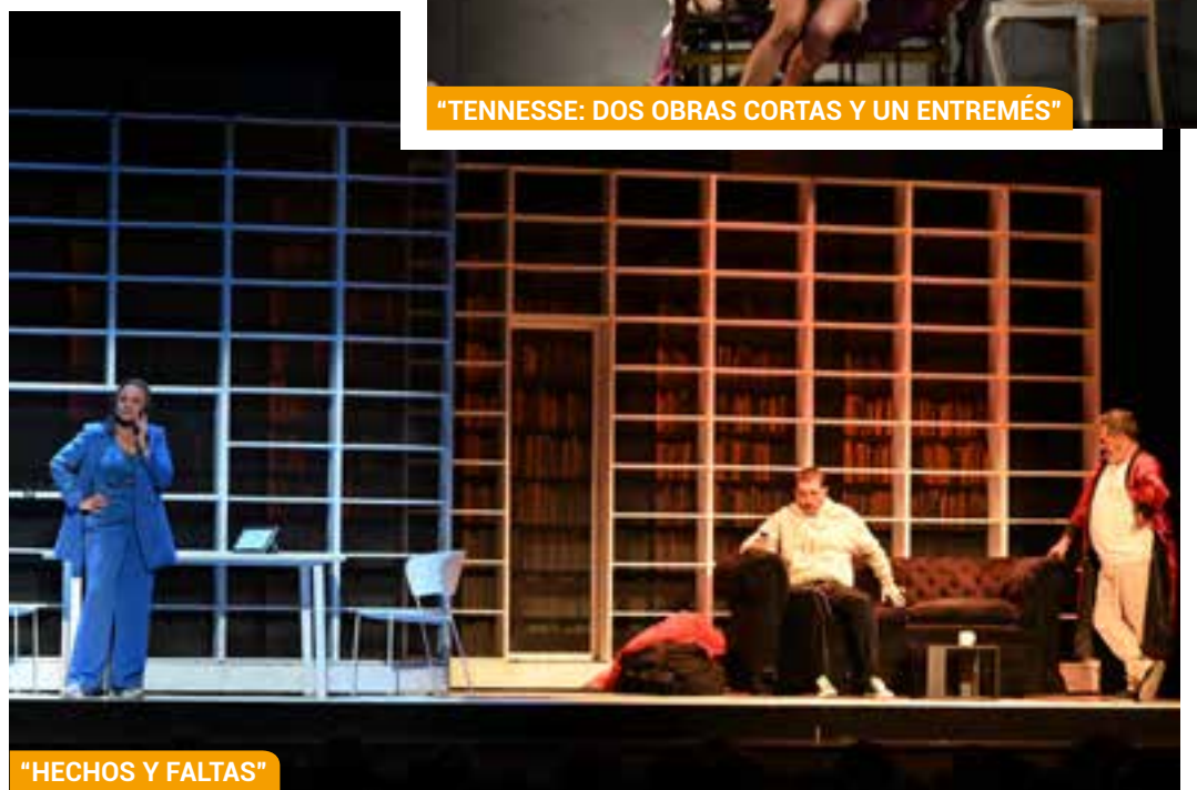
“HECHOS Y FALTAS”