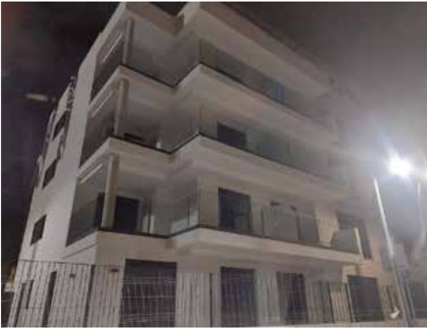
Obra nueva en Tomares