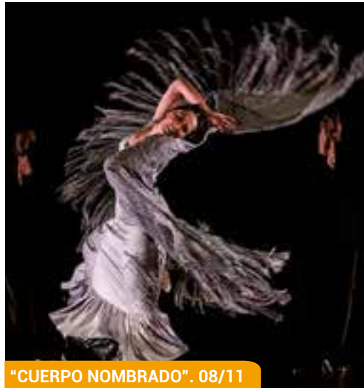
"CUERPO NOMBRADO". 08/11

Y otro esperado regreso ha sido el del Mercado del Arte, que extiende sus tenderetes de nuevo cada sábado por la mañana en las Cuatro Esquinas.