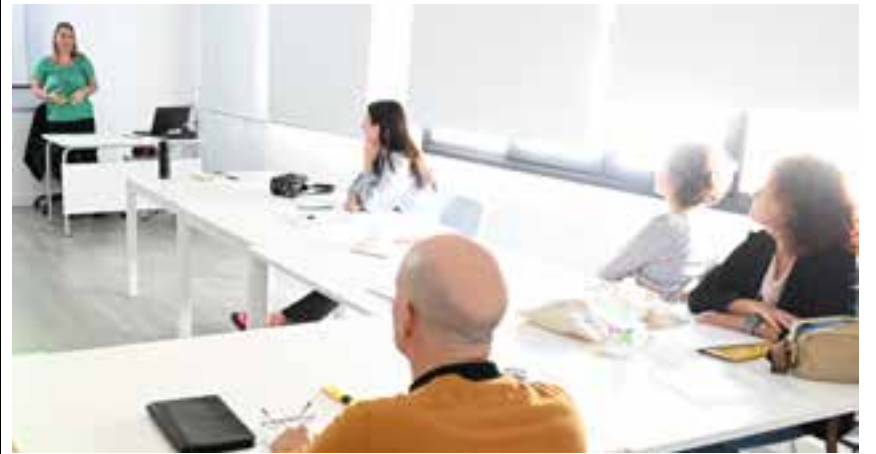
Alumnos en el curso para aprender técnicas para hacer una entrevista de trabajo

Además, el Ayuntamiento y el colegio Al-Andalus 2000 están colaborando con la Universidad de Vitoria para los cursos homologados de "Monitor de Comedor Escolar" (25 y 26 de octubre y 8 y 9 de noviembre) y de "Monitor de Aula Matinal" (22, 23, 29 y 30 de noviembre). Se imparten en este centro escolar y ambos cuentan con 20 plazas limitadas por orden de matriculación.