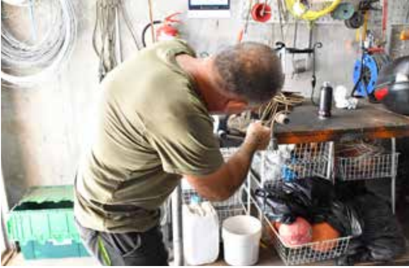
El programa beneficia a muchos colectivos en exclusión social