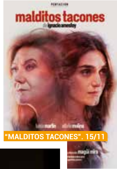
"MALDITOS TACONES". 15/11