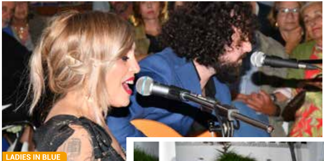
LADIES IN BLUE

El ocio y la cultura se han aliado en Tomares para que los meses de otoño estén cargados de actividades de todo tipo. El Otoño Cultural alcanza su ecuador con los distintos conciertos, exposiciones y actuaciones que se han podido disfrutar ya en varios puntos de la geografía tomareña. También el cine y las distintas opciones familiares y para los más pequeños han llenado de grandes momentos estas semanas.