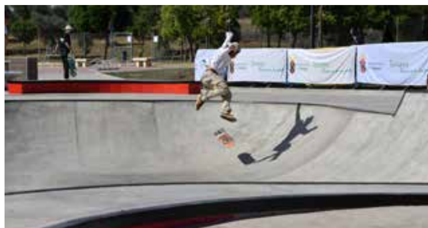
Patinador concursando en una de las categorías del campeonato de patinaje