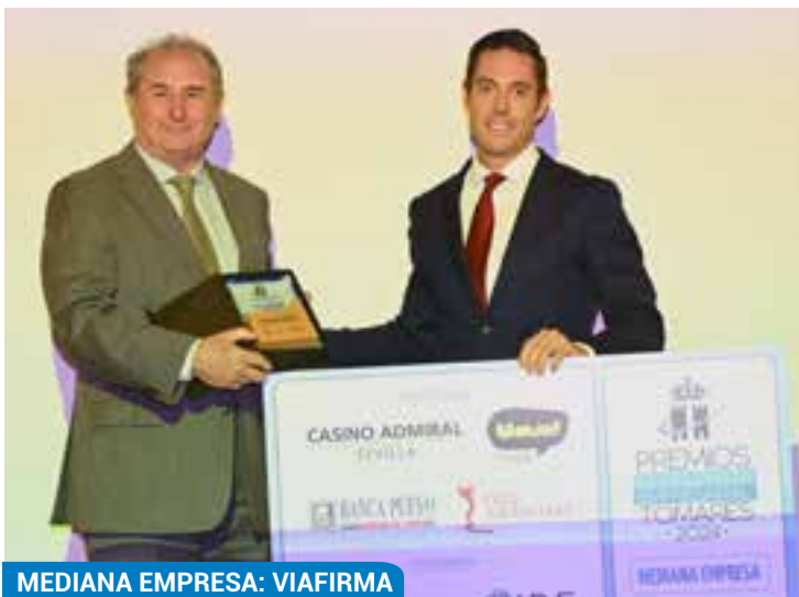
MEDIANA EMPRESA: VIAFIRMA