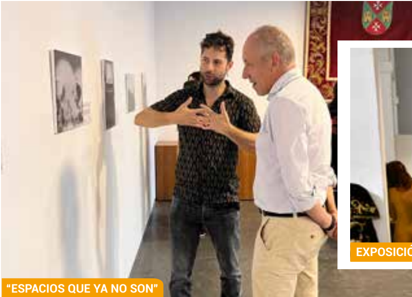
“ESPACIOS QUE YA NO SON”