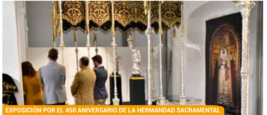
EXPOSICIÓN POR EL 450 ANIVERSARIO DE LA HERMANDAD SACRAMENTAL

octubre al 23 por las inclemencias meteorológicas.