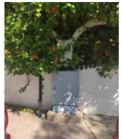
Antes y después de una de las pintadas eliminadas por el Ayuntamiento