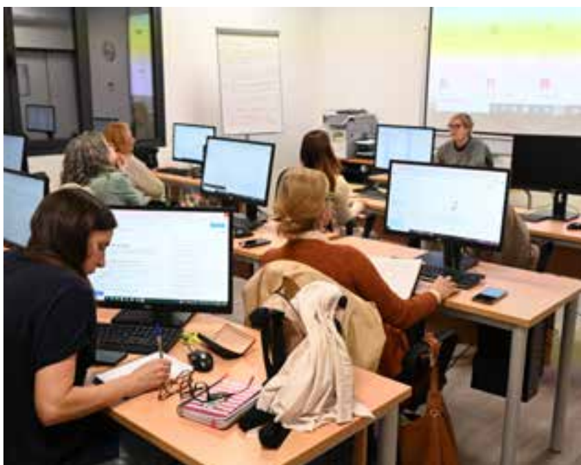
Alumnas en la octava edición del curso de Digitalización Aplicada en el Tomás de Ybarra

Tendrán lugar en el Centro Cultural Tomás de Ybarra, en aulas CCT-3 y CCT-4, cuyo mobiliario y equipamientos proceden de la ejecución del Proyecto/actuación denominado Equipamiento de las aulas polivalentes del antiguo Colegio Tomás de Ybarra de Tomares (Sevilla), con cargo a la convocatoria de subvenciones 2023 a conceder, en régimen de concurrencia no competitiva, por el Área de Concertación de la Diputación Provincial de Sevilla, a entidades locales de la provincia para la realización de actividades dentro de su ámbito competencial, aprobado mediante Resolución nº 297/2023 de fecha 25 de enero de 2023.