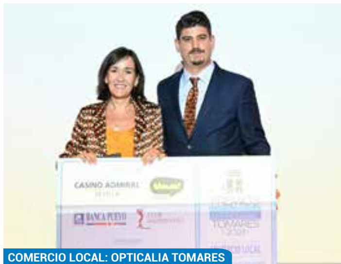
COMERCIO LOCAL: OPTICALIA TOMARES