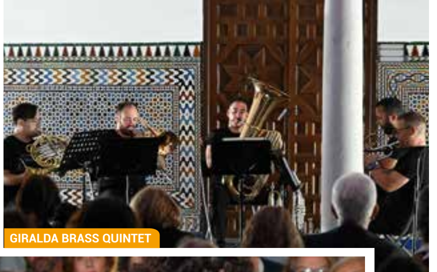
GIRALDA BRASS QUINTET