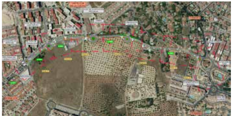
Plano general de la ampliación de la calzada y mejora del firme en la carretera A-8063

La carretera A-8063, con una longitud total de 1,22 kilómetros, une los