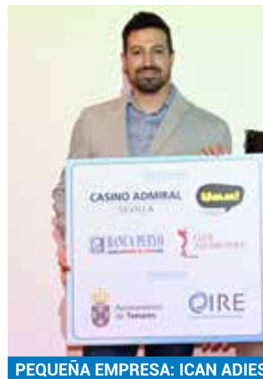
PEQUEÑA EMPRESA: ICAN ADIESTRAMIENTO CANINO