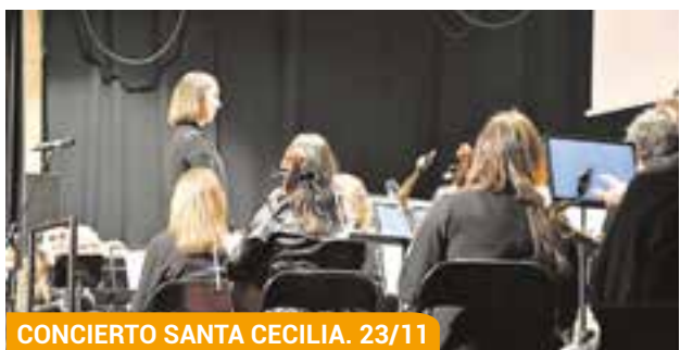
CONCIERTO SANTA CECILIA. 23/11