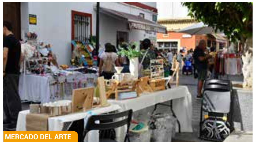
MERCADO DEL ARTE