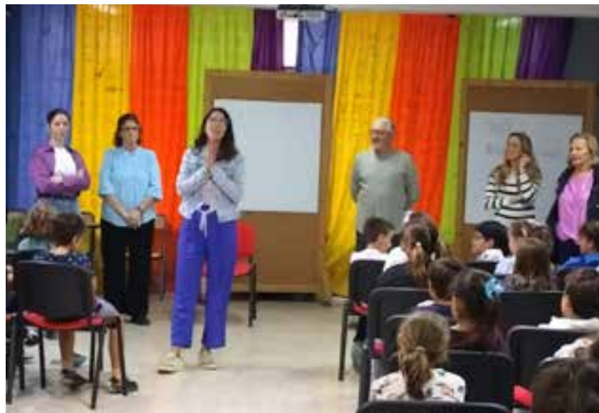
Presentación del IX Concurso de Relatos "Carmen Sevilla" organizado por AFAeN

car su imaginación en la creación de obras literarias donde la historia gire alrededor de sus mayores, y que sirve una vez más para visibilizar la incidencia de la enfermedad del alzheimer en estas personas. El concurso fue presentado en los distintos centros escolares del municipio.