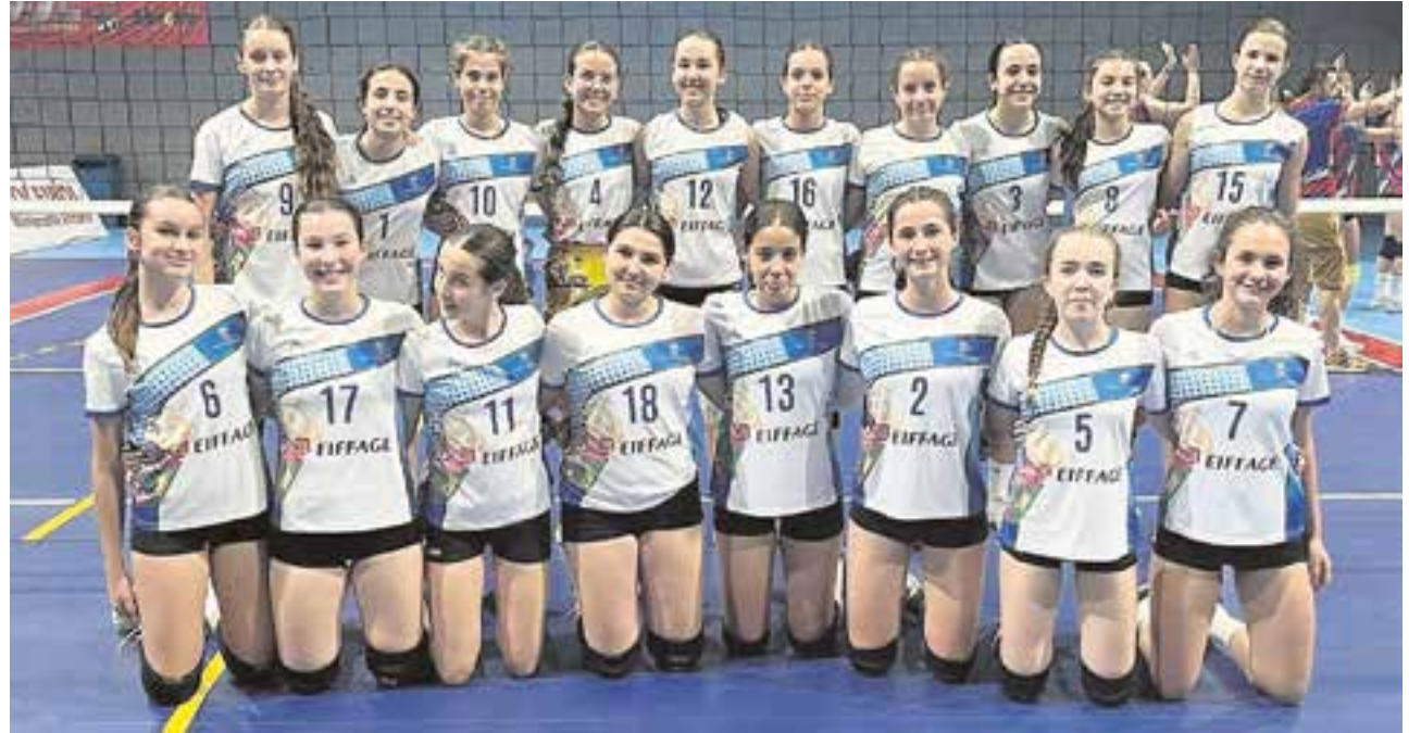
Componentes del equipo infantil de la Escuela Deportiva Municipal de Voleibol de Tomares en el pasado Campeonato de España