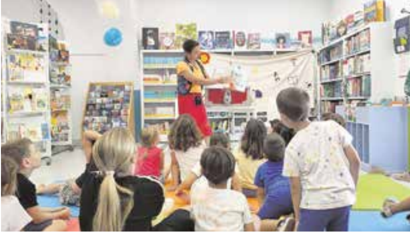
Pequeños disfrutando de "La Hora del Cuento" en la Biblioteca Municipal