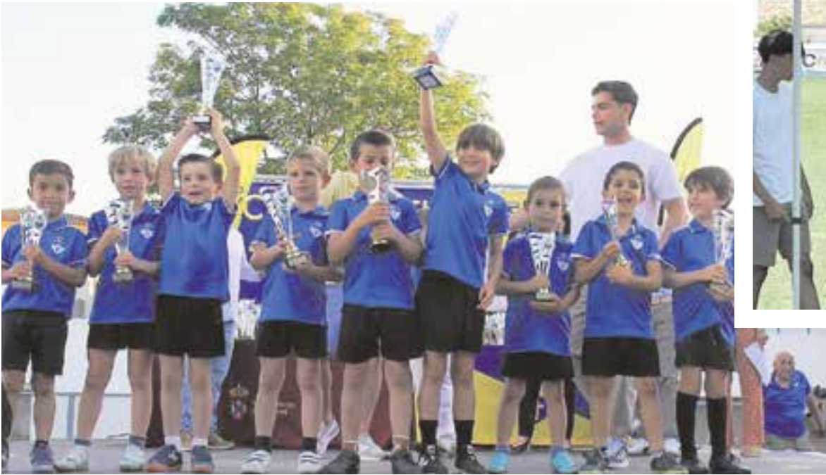
Arriba, pequeños del Camino Viejo recogiendo sus trofeos; al lado, los de la UD Tomares también obteniendo sus premios