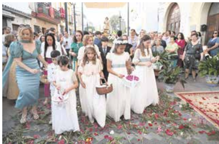
A la izquierda, salida de la Sagrada Custodia de la parroquia de Nuestra Señora de Belén el pasado sábado, 1 de junio; sobre estas líneas, niños que han hecho la Primera Comunión este año acompañando el paso del Niño Jesús