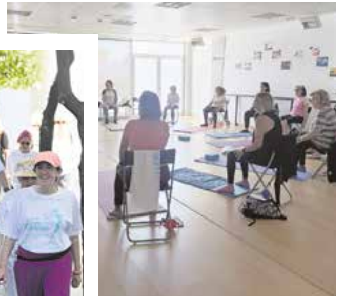
A la izquierda, mujeres participando en la clase de yoga que tuvo lugar en los Jardines del Conde; en el centro, "Marcha por la salud" celebrada el 28 de mayo; sobre estas líneas, taller sobre cómo mejorar el suelo pélvico impartido en el Complejo Polideportivo "Miguel Ángel Blanco"