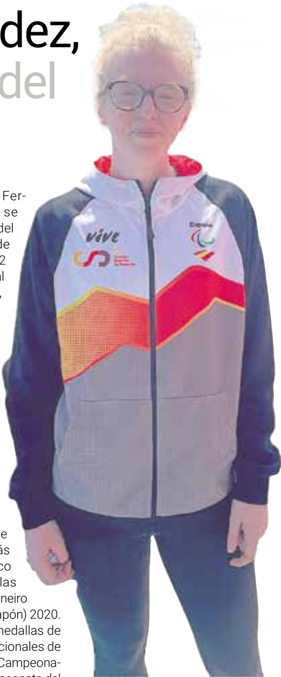
La atleta paralímpica Sara Fernández en el Mundial de Atletismo Adaptado que se celebró en Kobe (Japón)

También atesora tres medallas de bronce en eventos internacionales de primer orden como son el Campeonato de Europa (dos) y el Campeonato del Mundo (una). Además es Campeona de España en salto de longitud T12 en el Campeonato de España de Atletismo Adaptado.