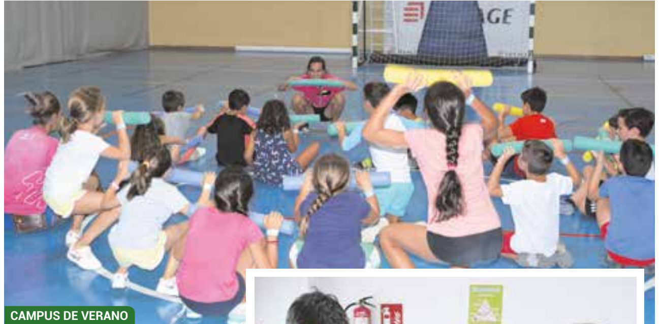
CAMPUS DE VERANO

LA PROGRAMACIÓN INCLUYE 25 CAMPUS DE VERANO (4 CAMPUS DEPORTIVOS Y 21 CAMPUS INNOVA) Y 9 ESCUELAS DEPORTIVAS MUNICIPALES DE VERANO, QUE SE EXTENDERÁN HASTA EL 6 DE SEPTIEMBRE, ANTES DE EMPEZAR LAS CLASES