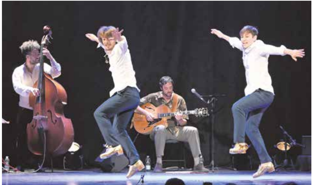
Una de las actuaciones del VI Suntap Festival que tuvo lugar en el Auditorio Municipal Rafael de León el pasado 12 de mayo