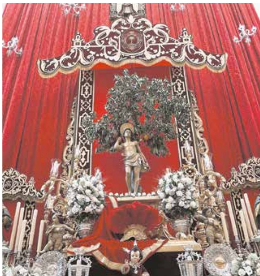
San Sebastián presidiendo el altar en la fachada del Círculo Mercantil de Sevilla

El Corpus es uno de los días más importantes del año en nuestro calendario de tradiciones, festividad con la que los tomareños se vuelcan montando altares, engalanando sus balcones y embelleciendo las calles.