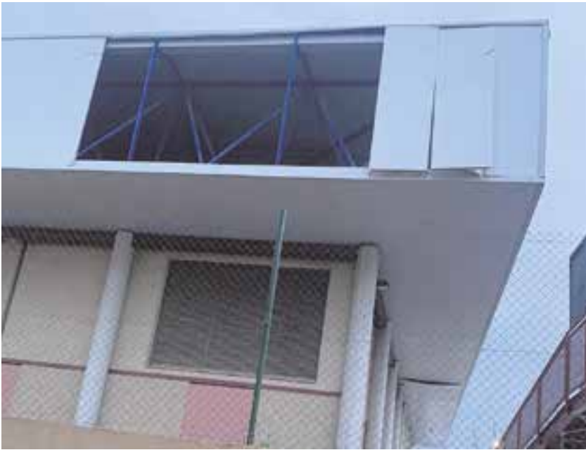
El mal estado del pabellón, agravado por un temporal