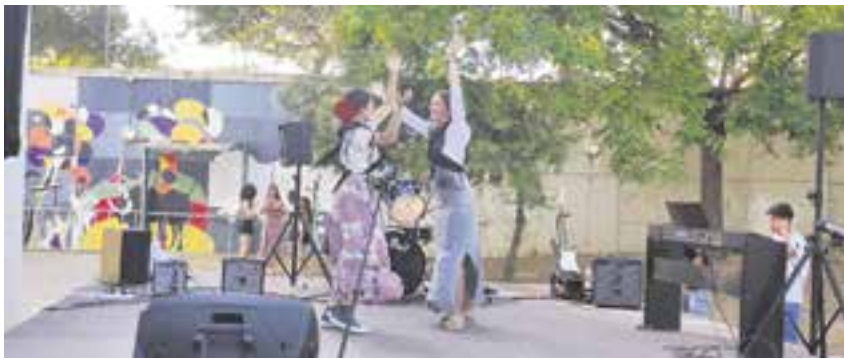
Alumnas realizando una de las actuaciones del “Loco Festival” en el IES Ítaca