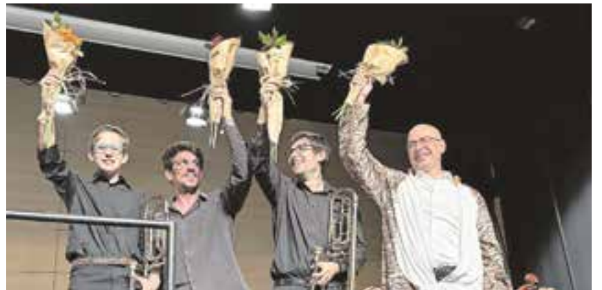
Reconocimiento a los cuatro solistas del concierto Gran Reserva de la BSMT 2024