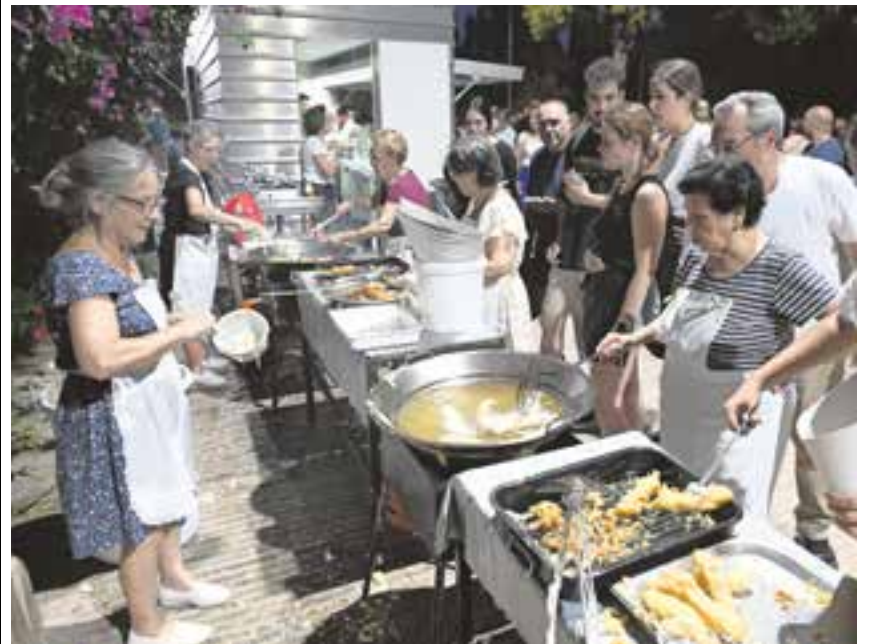
Las pavías podrán volver a degustarse cada viernes y sábado a partir del 28 de junio

Ayuntamiento, donde los tomareños y visitantes podrán disfrutar del mejor ambiente entre familiares, amigos y vecinos. Un ambigú impregnado del sabor añejo de las tradiciones, donde disfrutar, además de las pavías, de otras tapas de toda la vida junto a una bebida para refrescar el calor del periodo estival. Además, por una buena causa, ya que lo recaudado irá destinado a la bolsa de caridad de la Hermandad.