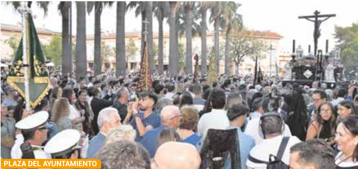
PLAZA DEL AYUNTAMIENTO

La BST, la Escolanía y la Polifónica abren sus plazos para introducir nuevos componentes.