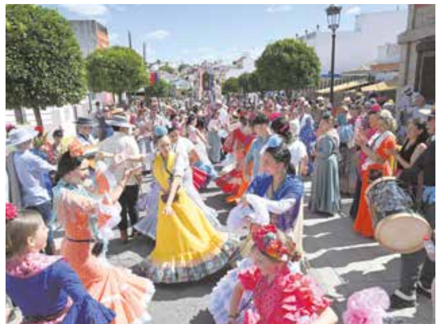
Tomareñas bailando sevillanas frente al Simpecado a su paso por las calles del municipio

Con las emociones a flor de piel, tras haber vivido, un año más, su reencuentro con la Reina de las Marismas, el Simpecado volvió a Tomares el pasado 22 de mayo, y a las 22:30 horas se recogió en la Parroquia Ntra. Sra. de Belén.