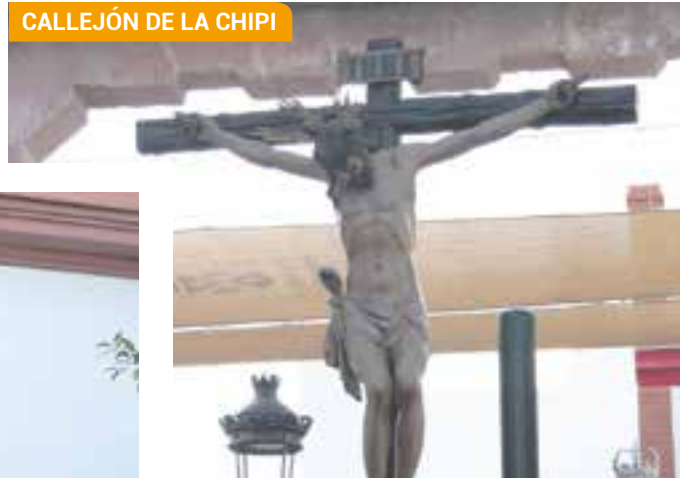
CALLEJÓN DE LA CHIPI