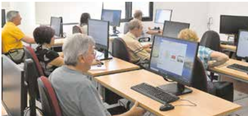
Alumnos aprendiendo en la primera edición del programa "Mayores Digitales"