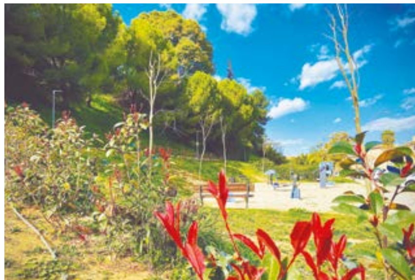
El talud de la calle Triana luce en todo su esplendor tras su regeneración integral

este espacio verde. El proyecto requirió una inversión de 209.013,92 euros, que han sido financiados a través del Plan Contigo.