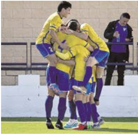
La UD Tomares sigue subiendo puestos, hasta el cuarto

to que les permite jugar los play-off de ascenso. También celebraron la victoria frente al Andalucía Este CF y un empate a uno contra el Benacazón CF.