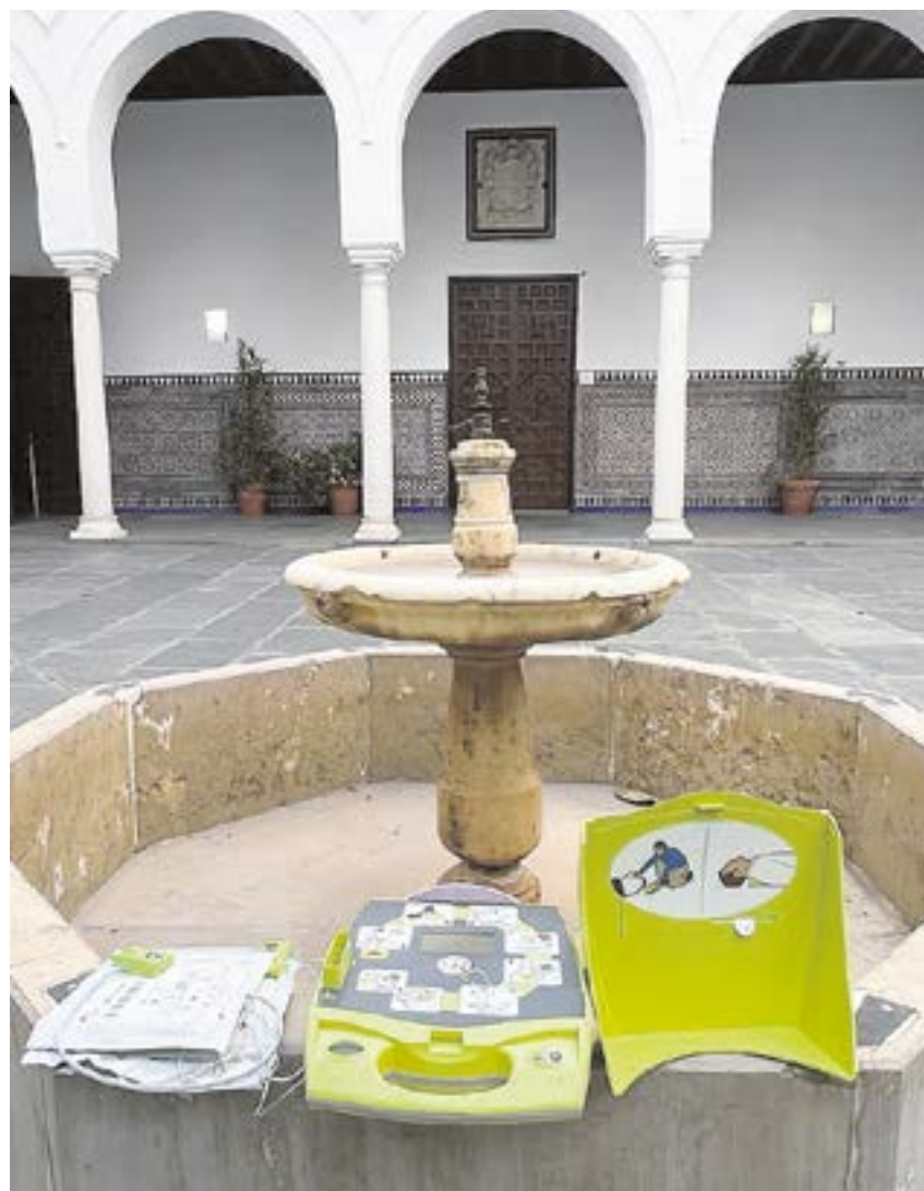
Los desfibriladores, una buena ayuda en la atención cardiorrespiratoria

En este sentido, el Ayuntamiento ha apostado para que los agentes de la Policía Local de Tomares así como el personal técnico que trabaja en las instalaciones municipales, estén preparados en el uso y manejo de este tipo de aparatos, formación que les ha permitido salvar ya a casi una decena de infartados en el municipio.