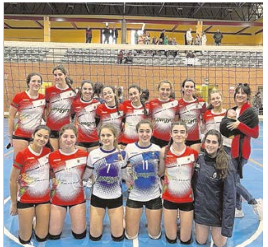
Integrantes del equipo juvenil femenino de voleibol de Tomares, campeonas de Liga