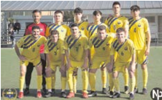
El Camino Viejo CF está en puestos de play-off de ascenso