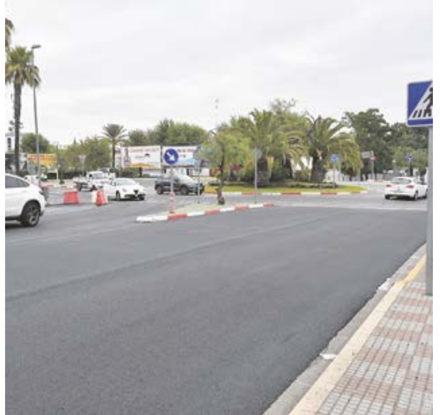
Aspecto de la Avenida de la Arboleda tras los trabajos de asfaltado

SEGUIMOS TRABAJANDO EN LAS OBRAS QUE MEJOREN LA CALIDAD DE VIDA DE LOS TOMAREÑOS, HACIENDO DE NUESTRO MUNICIPIO UN LUGAR MEJOR POR EL QUE TRANSITAR TANTO A PIE COMO EN VEHÍCULO", SEÑALÓ EL ALCALDE