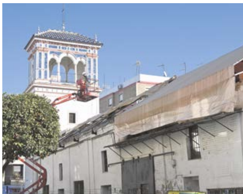
Operario trabajando en las obras del centro coworking y de ampliación de la biblioteca

El proyecto transformará este espacio en un centro multinegocios o vivero de empresas. También contará con un punto de información empresarial que permitirá a profesionales, emprendedores y pymes de diferentes sectores de Tomares compartir un mismo espacio de trabajo, tanto físico como virtual, para desarrollar sus proyectos profesionales de manera independiente, a la vez que fomentan proyectos conjuntos, lo que ayudará a fomentar las relaciones estables y sinergias entre los empresarios tomareños de diferentes sectores.