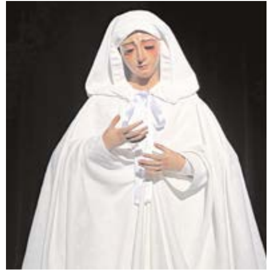
La Virgen de los Dolores, toda vestida de blanco, tras su vuelta al municipio el pasado sábado, 4 de febrero

EL PRESTIGIOSO RESTAURADOR FRANCISCO ARQUILLO HA ACOMETIDO A LA IMAGEN A UNA INTERVENCIÓN ÍNTEGRA DURANTE CUATRO MESES, DEVOLVIÉNDOLE TODO SU ESPLENDOR