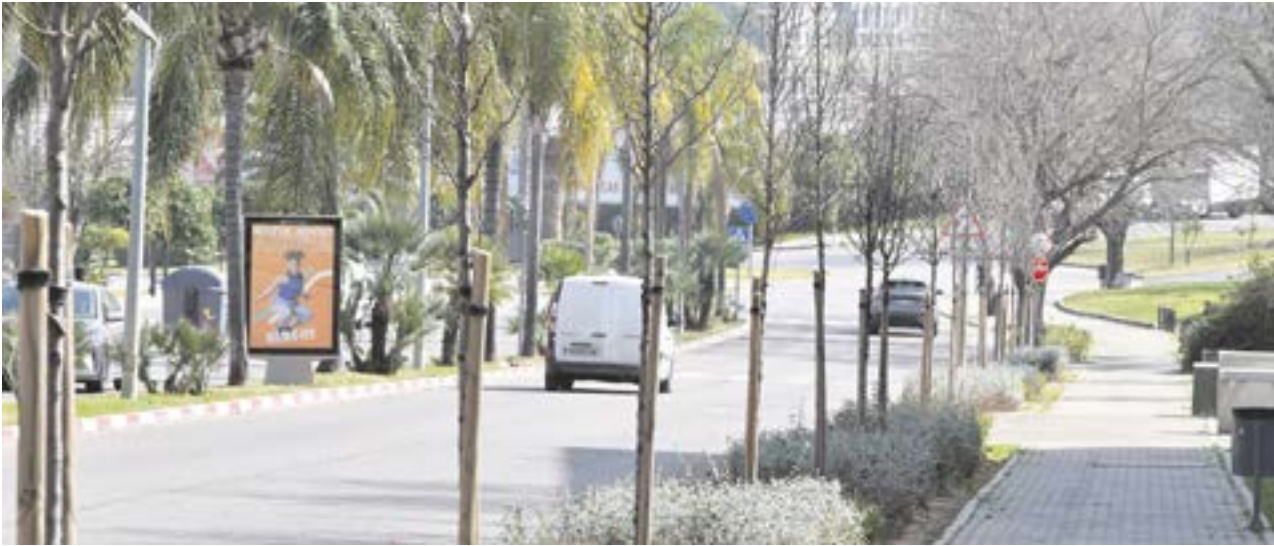
Avenida del Aljarafe, una de las zonas donde el Ayuntamiento ha hecho hincapié en la plantación de árboles

CONTINÚA ASÍ LA HABITUAL CAMPAÑA DE REFORESTACIÓN DE ZONAS VERDES QUE HA PERMITIDO AL AYUNTAMIENTO LA PLANTACIÓN DE MÁS DE 2.000 ÁRBOLES EN LOS ÚLTIMOS CUATRO AÑOS