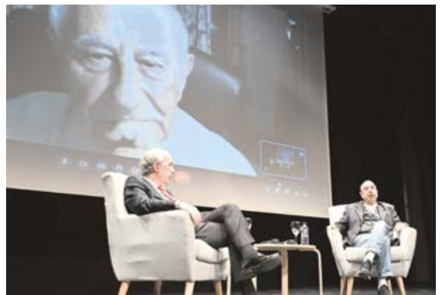
Inocencio Arias, que intervino por videoconferencia, junto a José Luis Garcí y Luis Alberto de Cuenca, en la mesa redonda del 22 de febrero