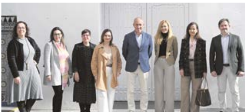
"Mujeres Sobresalientes" con el alcalde, el concejal de Desarrollo Económico y la presidenta del CIRE en la presentación de esta comunidad de empresarias

han realizado el primer bloque de cursos online, integrado por diez acciones formativas, y el de Control de Accesos, que han sido realizados por desempleados, empresarios y autónomos.