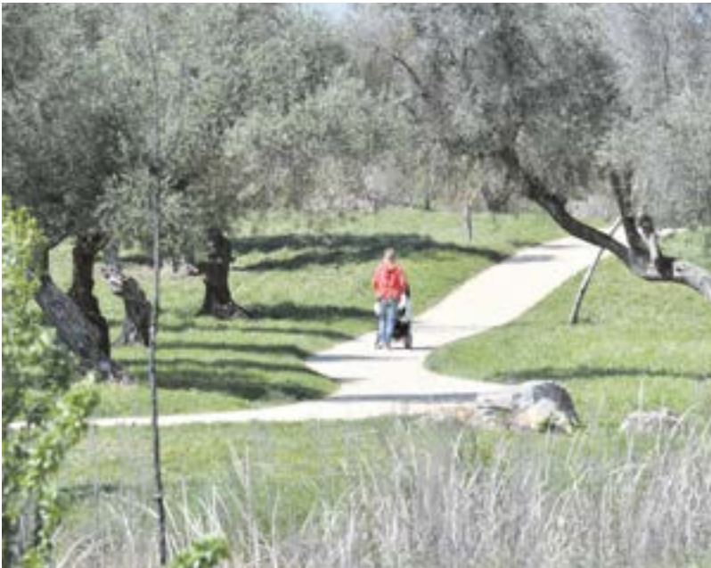
El Olivar del Zaudín se ha convertido en uno de los símbolos del bienestar de Tomares