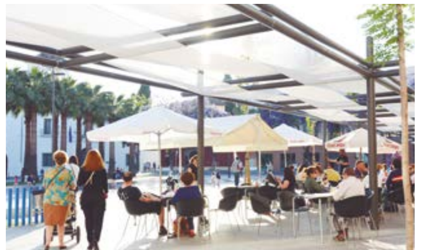
Alimentación, moda, librerías, calzado y bares, entre otros, adscritos al programa

“ABÓNATE AL COMERCIO DE TOMARES”: SE HABILITARÁ UNA PÁGINA WEB PARA LA ADQUISICIÓN DE ESTOS BONOS QUE COSTARÁN 15 EUROS Y CON LOS QUE SE PODRÁ GASTAR 20 EUROS EN DISTINTOS TIPOS DE ESTABLECIMIENTOS DEL MUNICIPIO