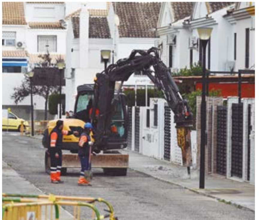
Operarios trabajando con maquinaria pesada en la calle Lola Flores

obras que se están llevando a cabo en Villares Altos, en las que se está actuando en la renovación de las estructuras y de los viarios públicos. Las obras se incluyen dentro del Plan Municipal de Inversiones (Plan Contigo) y las está realizando el Ayuntamiento de Tomares en colaboración con Aljarafesa.