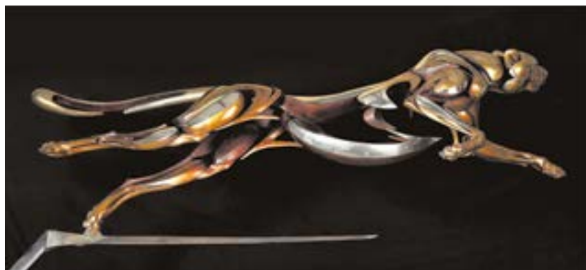
Toda la obra escultórica de Chiqui Díaz está basada en la naturaleza

El Salón de Plenos del Ayuntamiento expondrá, a partir del lunes, 6 de marzo, la muestra "La voz de las manos blancas". Está compuesta por una serie de 22 láminas que hacen un repaso por la historia de la banda terrorista ETA, desde su fundación en 1958 hasta su desaparición. A través de estas imágenes, cedidas por la fundación "Miguel Ángel Blanco", se muestra el sinsentido del propósito de la banda terrorista a través de los atentados que sembraron el país de dolor durante décadas. También se muestra la respuesta civil que desencadenaron sus atentados, sobre todo tras el asesinato del concejal de Ermua, Miguel Ángel Blanco.