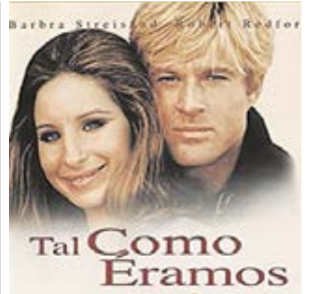
"Tal como éramos", el 15 de marzo